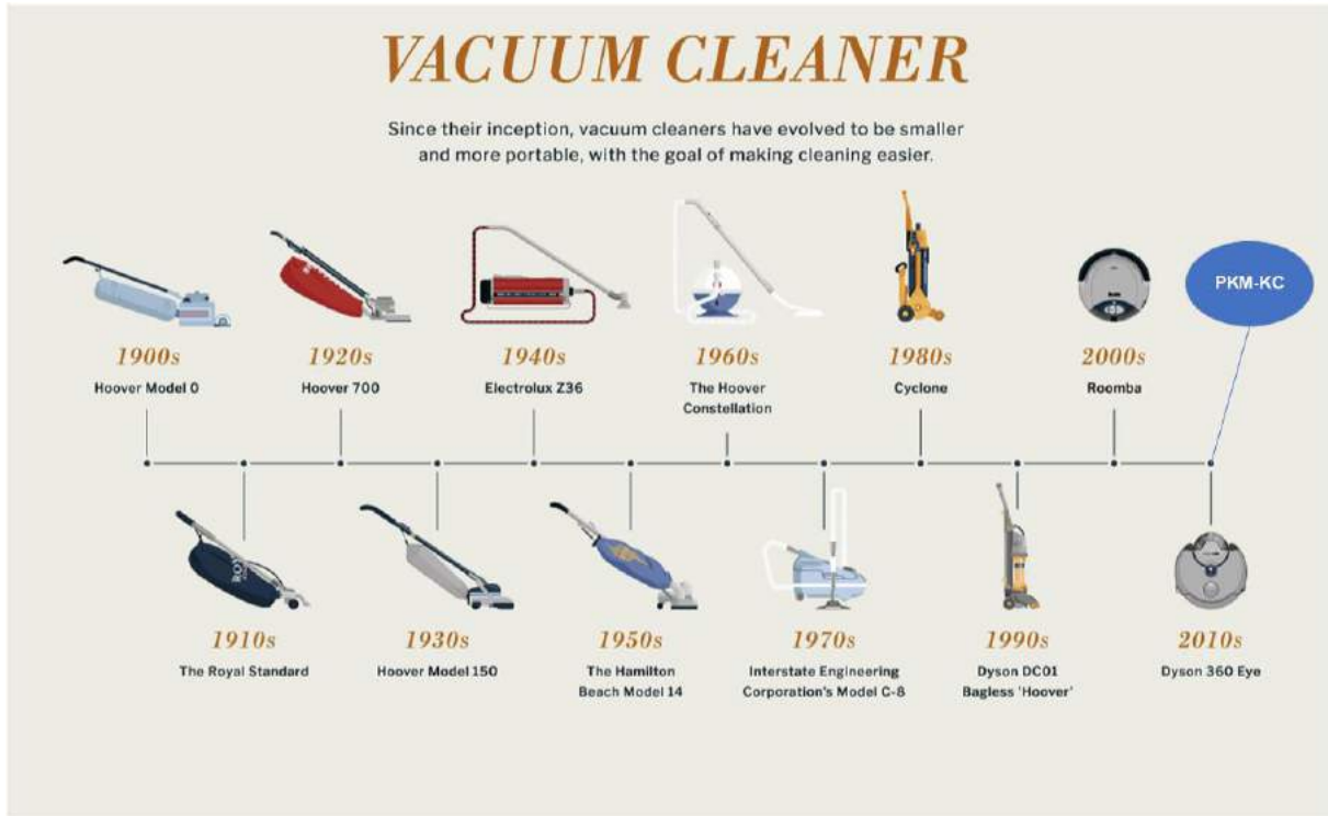
Gambar 2. Perkembangan vacuum cleaner dari tahun 1900 ke 2010 an

Berdasarkan uraian di atas PKM-KC lebih menekankan pada kreativitas produk yang akan dihasilkan, level teknologi, keterbaruan, metode pembuatan produk serta prediksi tingkat kemanfaatannya.