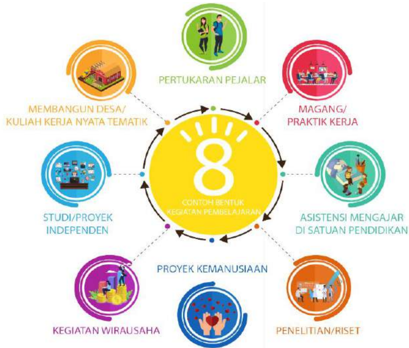
Gambar 4. Kegiatan pembelajaran sesuai Permendikbud No 3 Tahun 2020 Pasal 15 ayat 1

Penjelasan rekomendasi konversi sks dapat dilihat di Buku Pedoman. Bentuk kegiatan pembelajaran yang sesuai dengan PKM-KC adalah Studi/Proyek Independen seperti terlihat dalam Gambar 4.