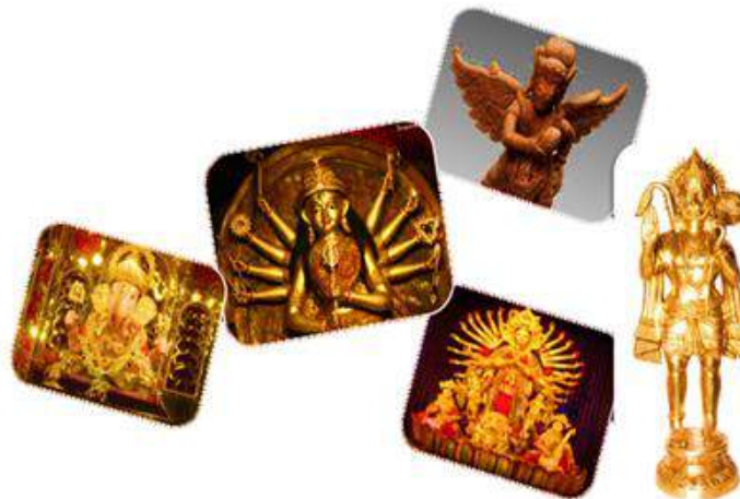
Gambar 1. Pratima Pura di Bali

Pembuatan sangkar gelombang elektromagnetik tidak kasat mata di sekitar pratima, berbasis sensor suhu tubuh manusia, yang segera berdenging menulikan telinga apabila ada orang yang berniat mencurinya akan berpotensi menjadi produk PKM-KC yang atraktif.